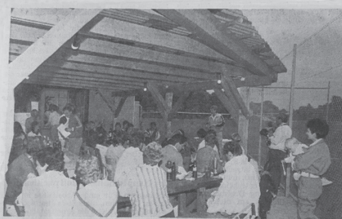
MIT EINER SCHÖNEN HOLZKONSTRUKTION haben die Mitglieder des Tennis-Clubs Worblingen an ihr Vereinsheim einen Anbau geschaffen, der es den Mitgliedern und den Besuchern erlaubt, unabhängig von der Witterung sich in der landschaftlich reizvollen Umgebung der „Oberwiesen“ aufzuhalten. Dies war am vergangenen Wochenende im besonderen Maß der Fall, als die Vereinsmeisterschaften ausgetragen wurden, über die wir noch berichten werden.

Die Fertigstellung der Tennisplätze Nr. 3 und Nr. 4 im April 1986 ermöglichte den Mannschaften des TCW die erstmalige Teilnahme an den Medenspielen des Verbands. Die Pergola bietet auch heute noch, nach 35 Jahren, den Mitgliedern die Möglichkeit die Verbandsspiele zu verfolgen oder sich zum geselligen Plausch niederzulassen.